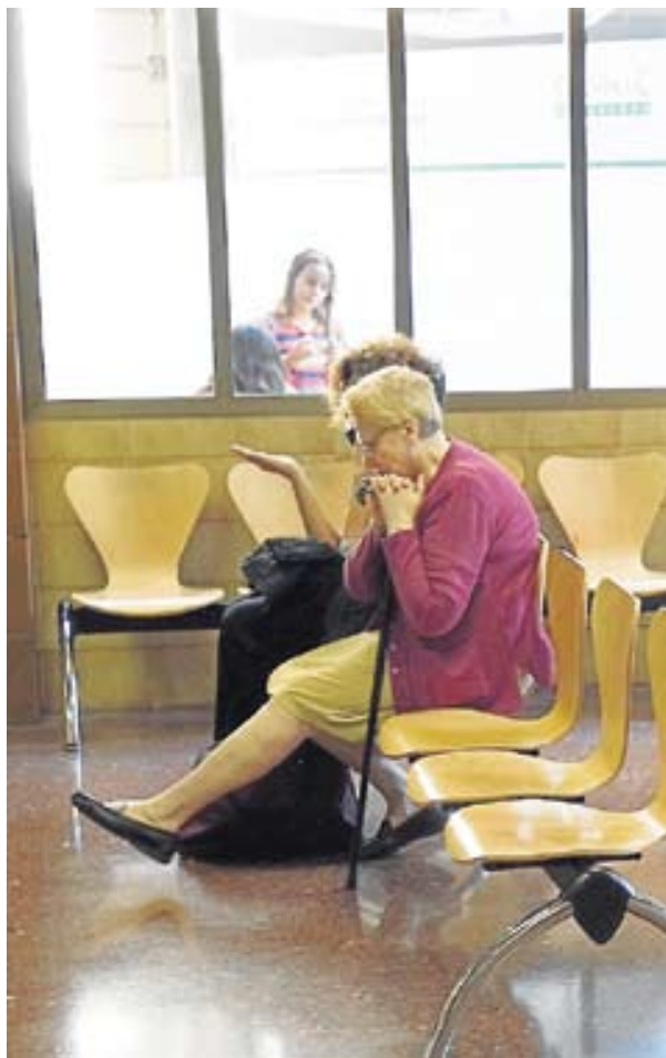
Una dona espera en un hospital. EDU BAYER

És per això que la conselleria haurà de fer una anàlisi centre per centre i, tenint present un mapa conjunt de tot Catalunya, decidir quines mesures de les proposades s'acaben duent a terme per fer la redistribució del servei públic. Aquesta fotografia definitiva ha d'estar llesta abans de les vacances de Setmana Santa.