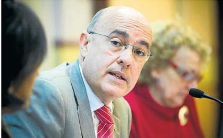
El conseller de Salut, Boi Ruiz, es mostra expectant a les reaccions que provoca el pla d'ajust sanitari. A la imatge, durant una reunió amb infermeres dijous passat. JORDI PIZARRO

"Les entitats no podran assumir les retallades del pressupost només aplicant mesures de gestió", insisteix la Unió Catalana d'Hospitals, que demana que el departament de Salut que practiqui un "abordatge global implicant tots els agents per permetre assolir acords que facin possible aquesta reestructuració de la manera més eficaç i menys lesiva possible". Així, la patronal demana