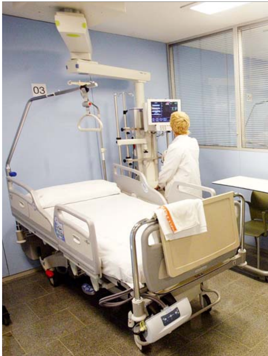
La patronal UCH alerta que caldrà ajustar la plantilla per arribar al 10% de reducció ■ G.M.

L'esforç exigít als centres es justifica, segons l'associació, per la situació econòmica, però “només té sentit si ha de permetre assolir en el termini més breu possible l'estabilitat del sistema”. ■