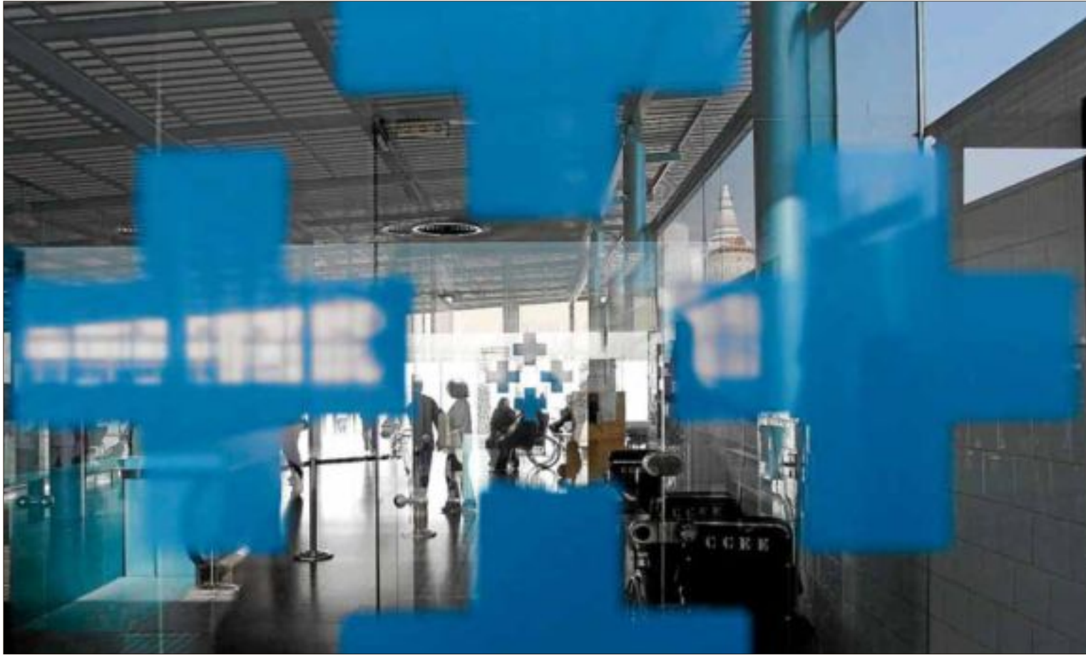
Entrada del Hospital del Mar, uno de los centros que ha paralizado sus obras de ampliación.