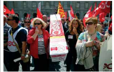
Delegats de la USOC fan sonar els seus xiulets davant del Palau de la Generalitat contra les retallades ■ QUIM PUIG