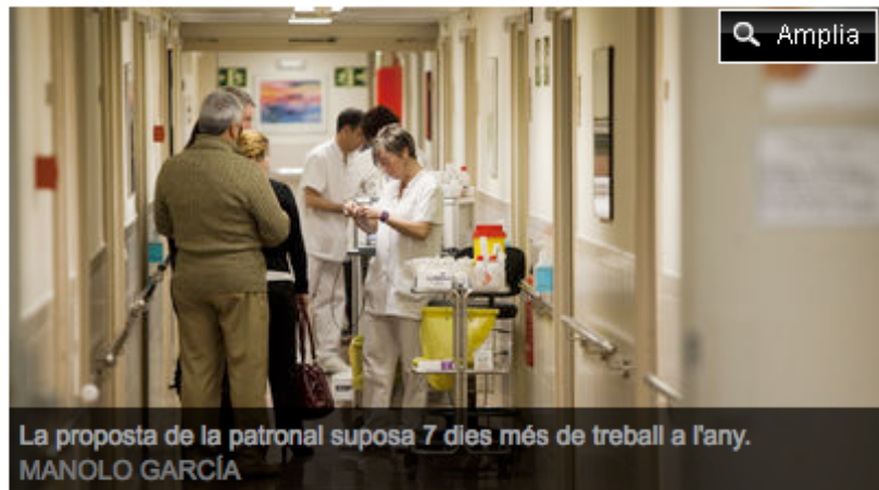
La proposta de la patronal suposa 7 dies més de treball a l'any. MANOLO GARCÍA

La Unió, el Consorci de Salut i Social de Catalunya (CSSC) i l'Associació d'Entitats Sanitàries i Socials (ACES) han emès un comunicat en el qual anuncien que recorreran a la mediació de l'autoritat laboral.