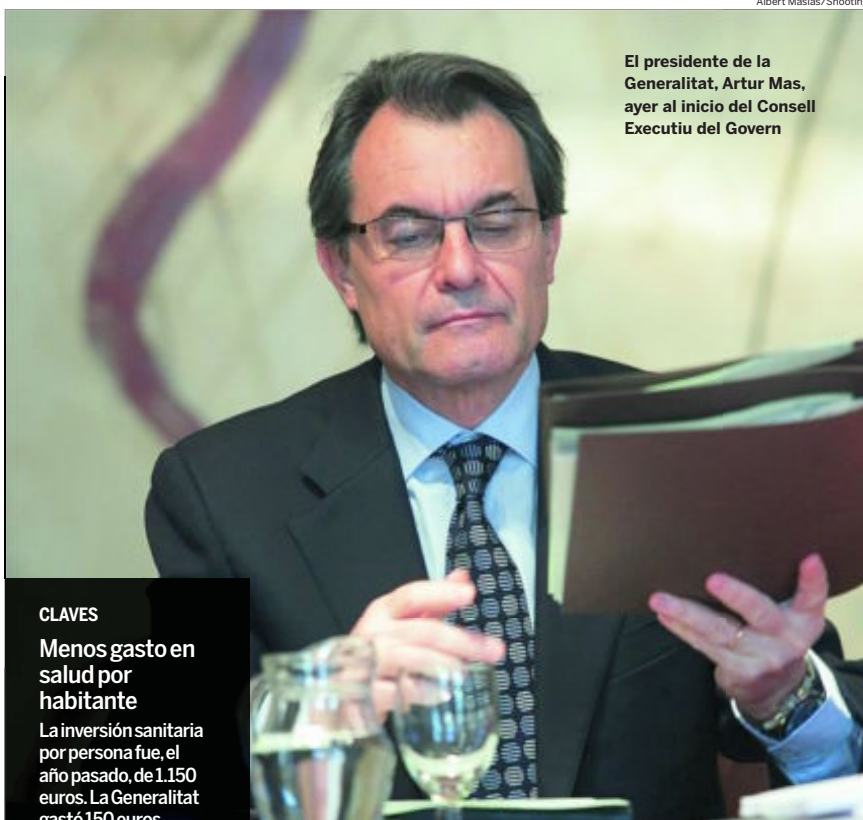
El presidente de la Generalitat, Artur Mas, ayer al inicio del Consell Executiu del Govern

De los 1.390 millones de euros, el Servei Català de la Salut (CatSalut) debe 840 millones de euros a las entidades sanitarias (el 190 por ciento de la facturación mensual); la conselleria de Bienestar y Familia adeuda 280 millones de euros al tercer sector por servicios prestados en 2012, de los 70 millones corresponden a la factura íntegra del mes de julio; y los 270 millones restantes se refieren a las facturas farmacéuticas que la Administra-