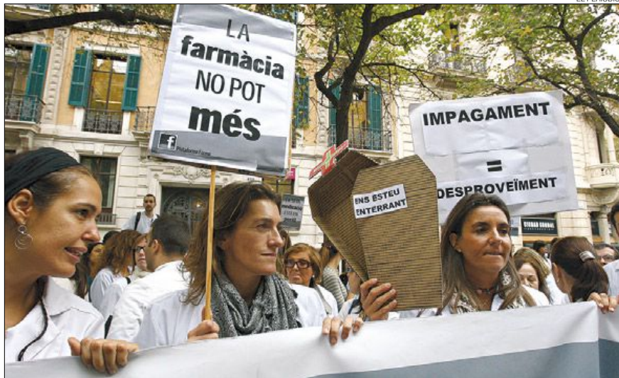
► Concentració de farmacèutics a la plaça de Sant Jaume, de Barcelona, el 21 de març.

► Un greu error en el servidor de la recepta electrònica paralitza totes les farmàcies