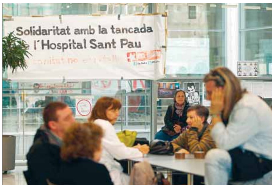
L'hospital Sant Pau haurà de pagar als treballadors el 5% de les retallades aplicades

Segons aquestes entitats, el govern els deu, aproximadament, 1.390 milions d'euros per les activitats de l'any passat i d'aquest 2013. Concretament, el Catsalut deu 840 milions d'euros i ha passat a pagar a 150 dies, quan abans ho feia a 90. El Departament de Benestar Social i Família té un deute de 280 milions d'euros i