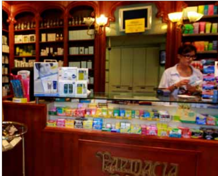
Interior de una farmacia en Barcelona.

Hartas de una situación de impasse que parece no tener fin, seis patronales (el Consorcio de Salud y Social de Cataluña, la Unión Catalana de Hospitales, el Consejo del Colegio de Farmacéuticos de Cataluña, la Federación Española de Empresas de Tecnología Sanitaria, la Asociación Catalana de Entidades de Salud y la Asociación Catalana de Recursos Asistenciales) han decidido aunar esfuerzos a través de un manifiesto conjunto para alertar de la «situación excepcional» que significa cobrar con hasta 290 días de retraso. Más de nueve meses de demora que colocan a los centros concertados entre la espada y la pared.