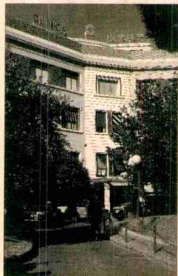
Entrada a la Clínica Corachan

Els laboratoris d'anàlisi Sabater Tobellà, amb seu central al carrer de Londres de Barcelona, van passar al final del 2006 a formar part del grup Samplers, un grup espanyolportuguès del