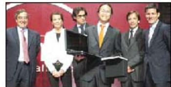
El president de Foment del Treball amb alguns dels premiats.