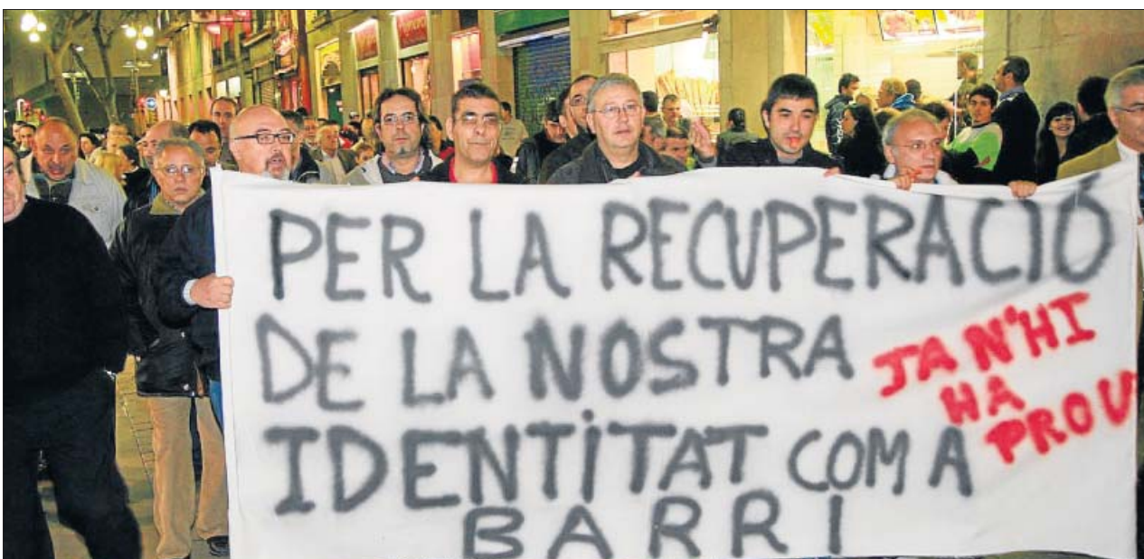
Medio centenar de vecinos del Raval se manistaron ayer contra la degradación del barrio por las calles del centro de la ciudad.

Las Drassanes acogieron ayer la entrega de los premios Barcelona, la millor botiga del món , para premiar establecimientos comerciales de la ciudad.