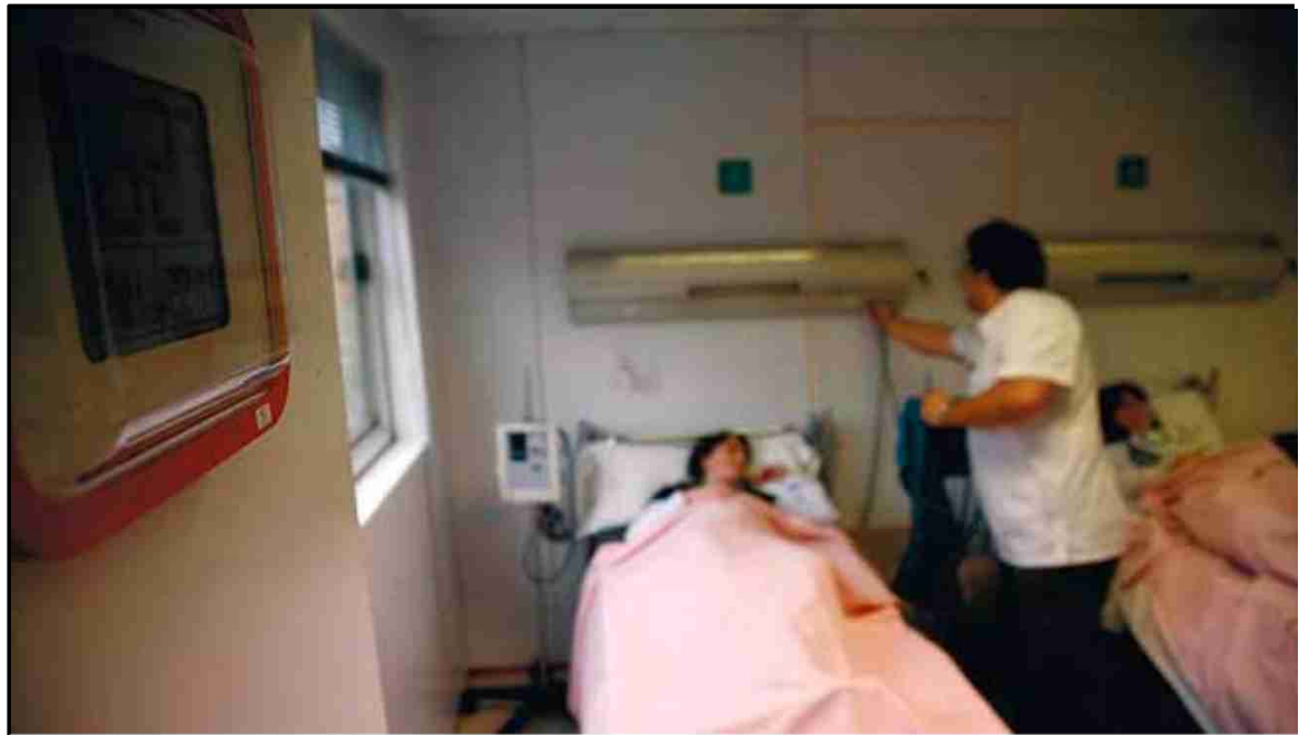
La patronal del sector sanitari proposa que es paguin els àpats o la bugaderia durant l'estada a l'hospital

La Unió Catalana d'Hospitals juntament amb Foment del Treball, Fepime Catalunya, Fenin Catalunya i la Federació de Mutualitats van presentar ahir vuit mesures per garantir la sostenibilitat del sistema sanitari, que van des de "la necessitat de condicionar tota nova prestació al pressupost" fins a establir taxes per fer que el ciutadà es pagui el cost del menjar o de la bugaderia quan està ingressat en un hospital. Les patronals van fer públic ahir aquest crit d'alerta, perquè consideren que