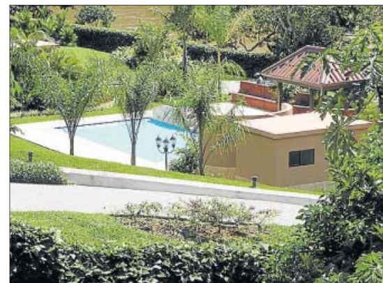
La vivienda del jefe de la organización en Costa Rica. CNP