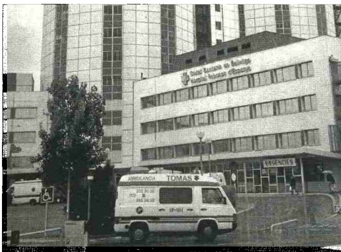
Hospital de Bellvitge en una imagen de archivo.

El apoyo de la patronal al copago sanitario que propone la consellera de Salut se hizo público a través de un pacto firmado ayer en Barcelona por Foment del Treball, la Unió Catalana d'Hospitals, Fepime Catalunya, Fenin Catalunya y la Federació de Mutualitats. El pacto, que contiene ocho propuestas, pasa por establecer unas «tasas de utilización asumibles reguladas para promover el uso racional