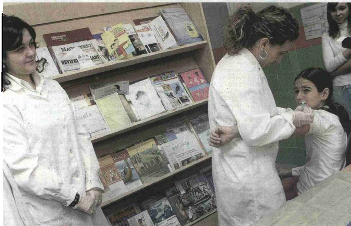
Cada dosis de vacuna está presupuestada en el mercado en aproximadamente 150 euros