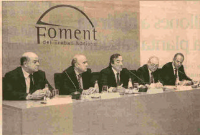
Cinco patronales firmaron ayer el documento que recoge medidas para la sostenibilidad del sistema.