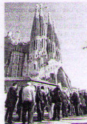
Cues per veure el temple.

BARCELONA// La junta constructora de la Sagrada Família va acordar ahir l'ampliació de l'horari de visita durant les jornades de portes obertes dels propers dissabtes 22 i 29 de gener, fins a les sis de la tarda. El motiu és la gran acollida i l'interès suscitat per la iniciativa de portes obertes de forma gratuïta, segons va informar l'entitat.