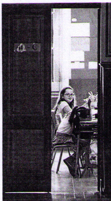
Dues alumnes en una escola de Barcelona.

És que hi ha temor sobre la retallada de sous i s'espera sobretot que el Govern mantingui el compromís de la LEC d'equiparar els sous i les condicions dels docents de l'escola concertada. I també se-