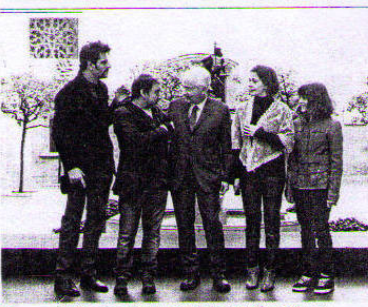
Mascarell i Joan amb alguns dels guardonats.