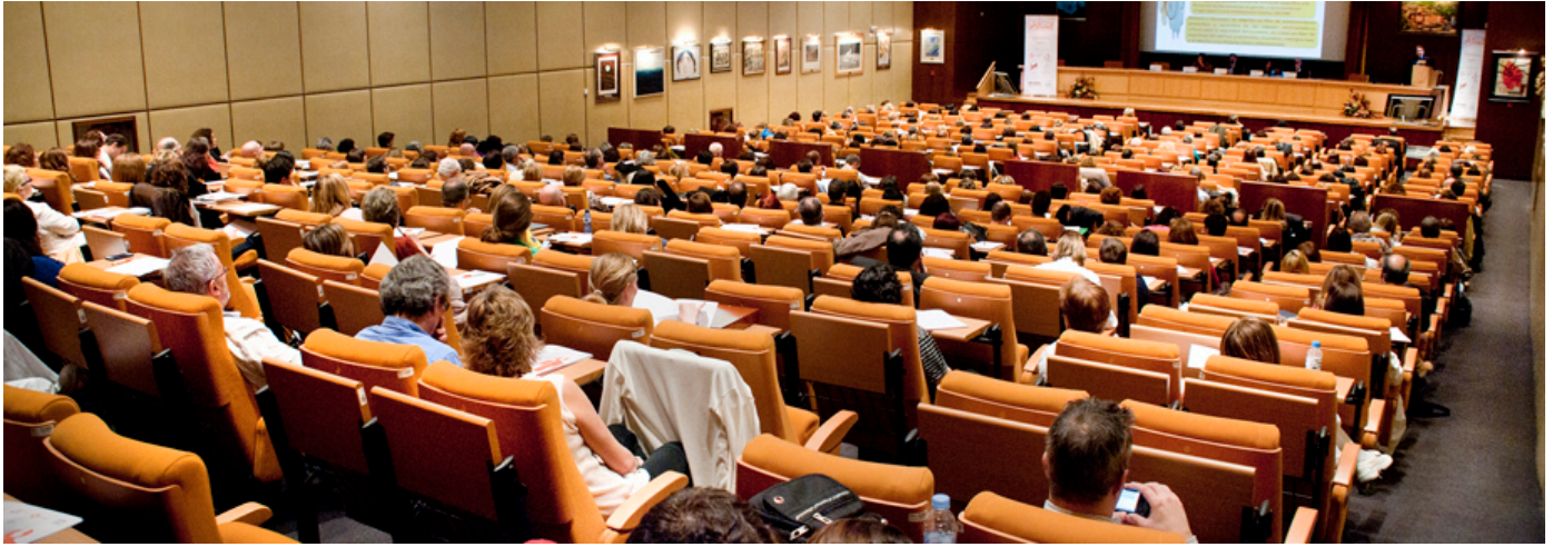
Vista general de la sala, el martes 26 en el Hospital Universitario Vall d'Hebron de Barcelona.