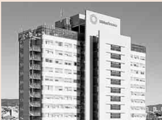
El Hospital Mútua de Terrassa es uno de los centros concertados.

Una de las áreas en las que La Unió está trabajando para que los centros reduzcan costes es la compra agregada de servicios a proveedores. “Se están haciendo cosas, pero los efectos se notarán a largo plazo”, comenta la directora general.