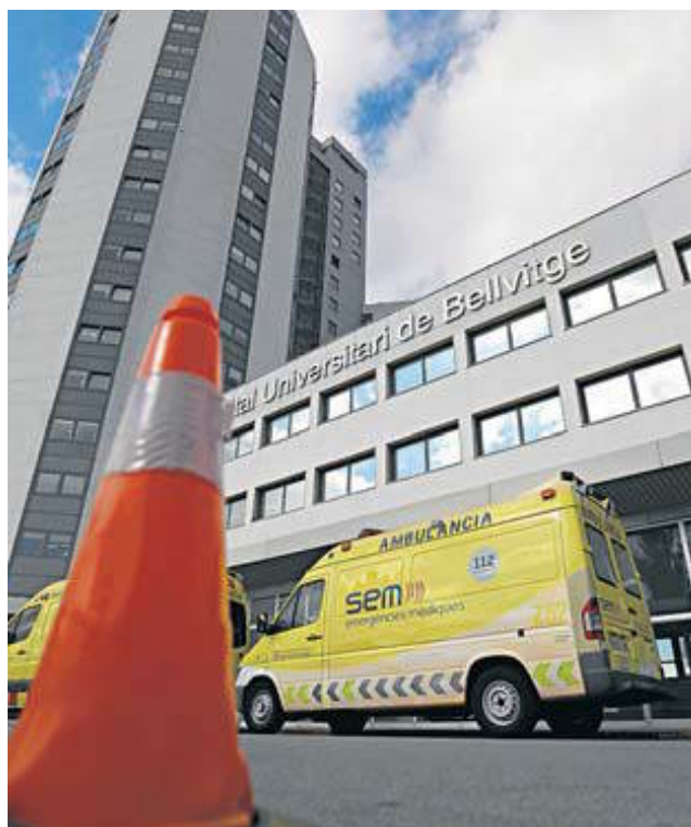
Els metges de l'Hospital de Bellvitge denuncien que el centre ha patit una retallada de 40 milions d'euros des del 2010. XAVIER BERTRAL

Resposta El conseller de Salut lamenta l'ús "polític" de la reducció de llits a l'estiu