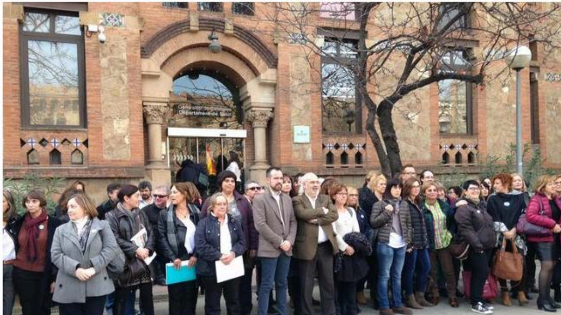
Concentració infermeres a la conselleria de Salut CARALP MARINÉ

Representants de diversos col·lectius d'infermeres s'han presentat el matí de dijous a les portes de la conselleria de Salut per fer-li arribar al conseller Toni Comín un manifest on exigeixen al Govern que aprovi el marc normatiu autonòmic de prescripció infermera, perquè puguin dispensar medicaments i productes als malalts.