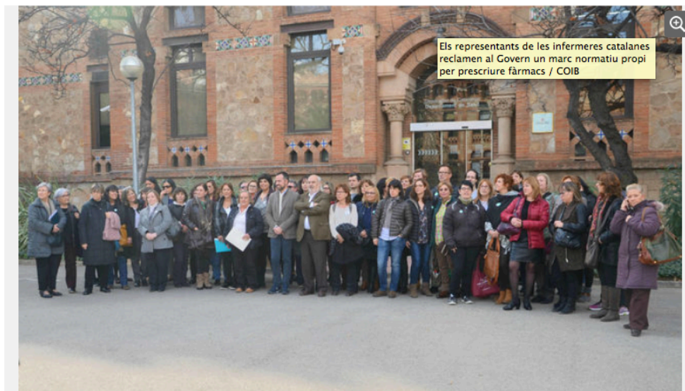
Els representants de les infermeres catalanes reclamen al Govern un marc normatiu propi per prescriure fàrmacs

MARIO MARTÍN MATAS Barcelona ACTUALITZADA EL 28/01/2016 18:54