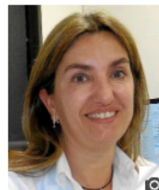
Assumpta Prat arxiu/jordi morros

remarquen que l'esmentat decret suposa un retrocés per a la professió importantíssim. Ahir, les infermeres catalanes -amb el suport d'altres estaments i col·lectius- van presentar un manifest a la Conselleria de Salut per reclamar que el Govern hi posi remei (vegeu el text del costat). La solució passa per aconseguir l'empara legal necessària. Una empara que no estava regulada abans del decret. Ara la situació s'ha agreujat: no la tenen i, si prescriuen, que és una pràctica habitual en el seu treball clínic quotidià, estan fora de la llei.