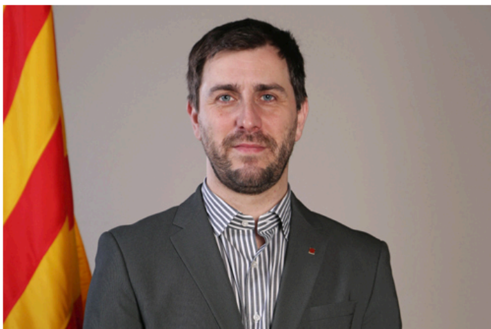
Toni Comín, consejero de Sanidad de Cataluña

Este miércoles, el consejero de Salud, Antoni Comín, destituyó de manera fulminante a todos los directivos colocados por la Generalitat en los consorcios sanitarios. De ellos dependen los centros de salud designados como colegios electorales para el 1 de octubre y el resto de clínicas y hospitales de la red regional. Comín se nombró a sí mismo presidente para asumir la responsabilidad. Al día siguiente, todas las patronales se han plegado y han anunciado que otorgarán horas a sus empleados para que vayan a votar el domingo 1-O al referéndum ilegal de independencia.