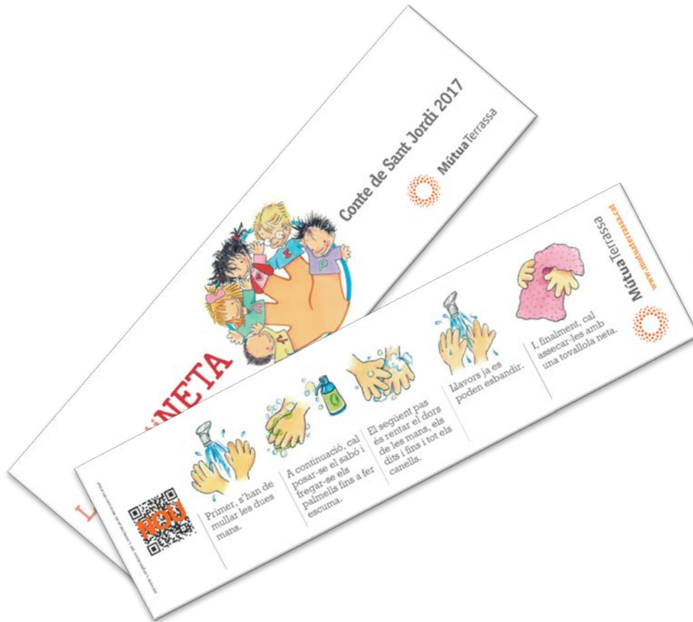
Punt de llibre