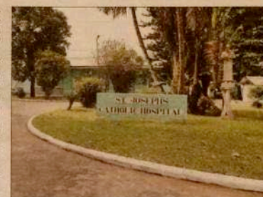
El hospital de San José de Monrovia, ahora cerrado.

Sin embargo, tuvieron que pasar tres días hasta que, el jueves