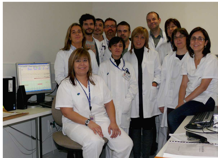
Equip de professionals de la Unitat del Son

Actualment es realitzen un total de 43 estudis setmanals, dels quals 25 es fan al domicili del pacients i 18 a les instal·lacions del Parc Taulí on es disposa de polisomnògrafs digitals (amb capacitat de registrar fins 57 canals de senyals a cada llit) amb registre sincronitzat de vídeo per infrarojos (que permet veure al pacient 'a les fosques'), a més de diversos aparells per ajustar la pressió dels aparells de CPAP nasal (aire a pressió a través del nas) que és el principal tractament de les apnees del son. Els aparells permeten realitzar estudis complexes a adults i nens.